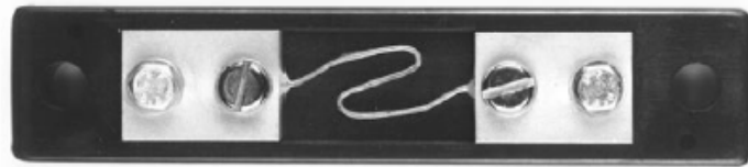
Шунты 1 ... 25 А